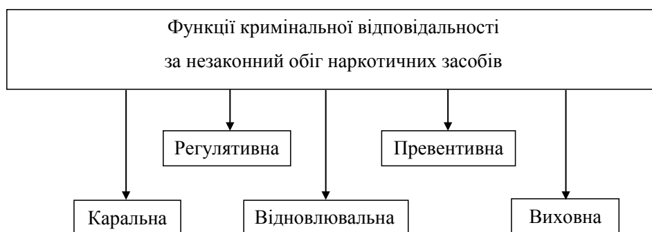
Рис. 2. Функції кримінальної відповідальності

Превентивна функція кримінальної відповідальності у даній сфері складається з двох взаємозв'язаних складових (рис. 2). По-перше, спеціального превентивного впливу, якій полягає